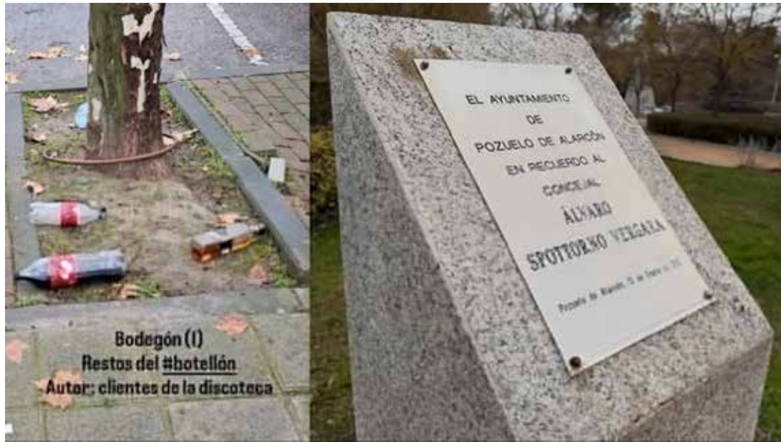
Bodegón (I) Restos del #botellón Autor: clientes de la discoteca