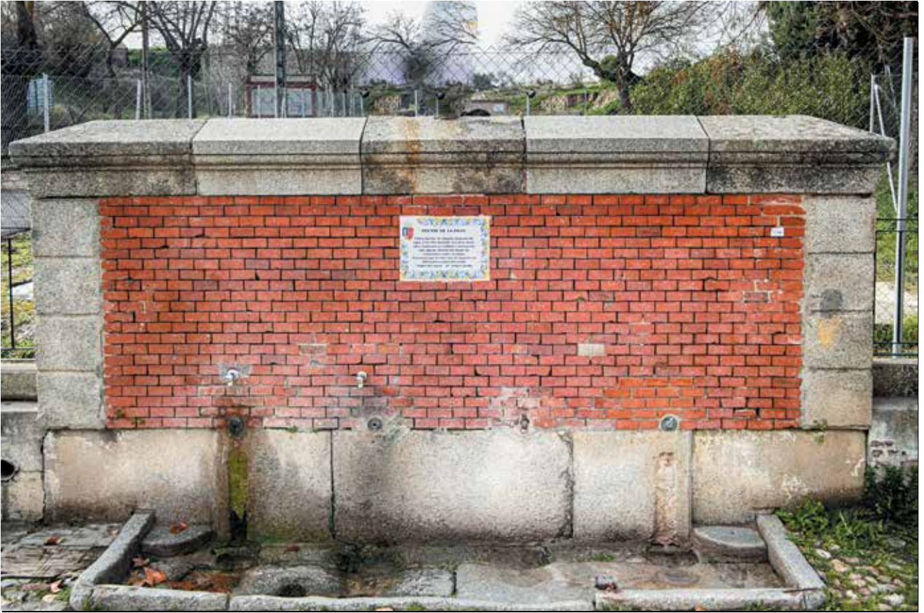
Imagen: Fuente de La Poza.