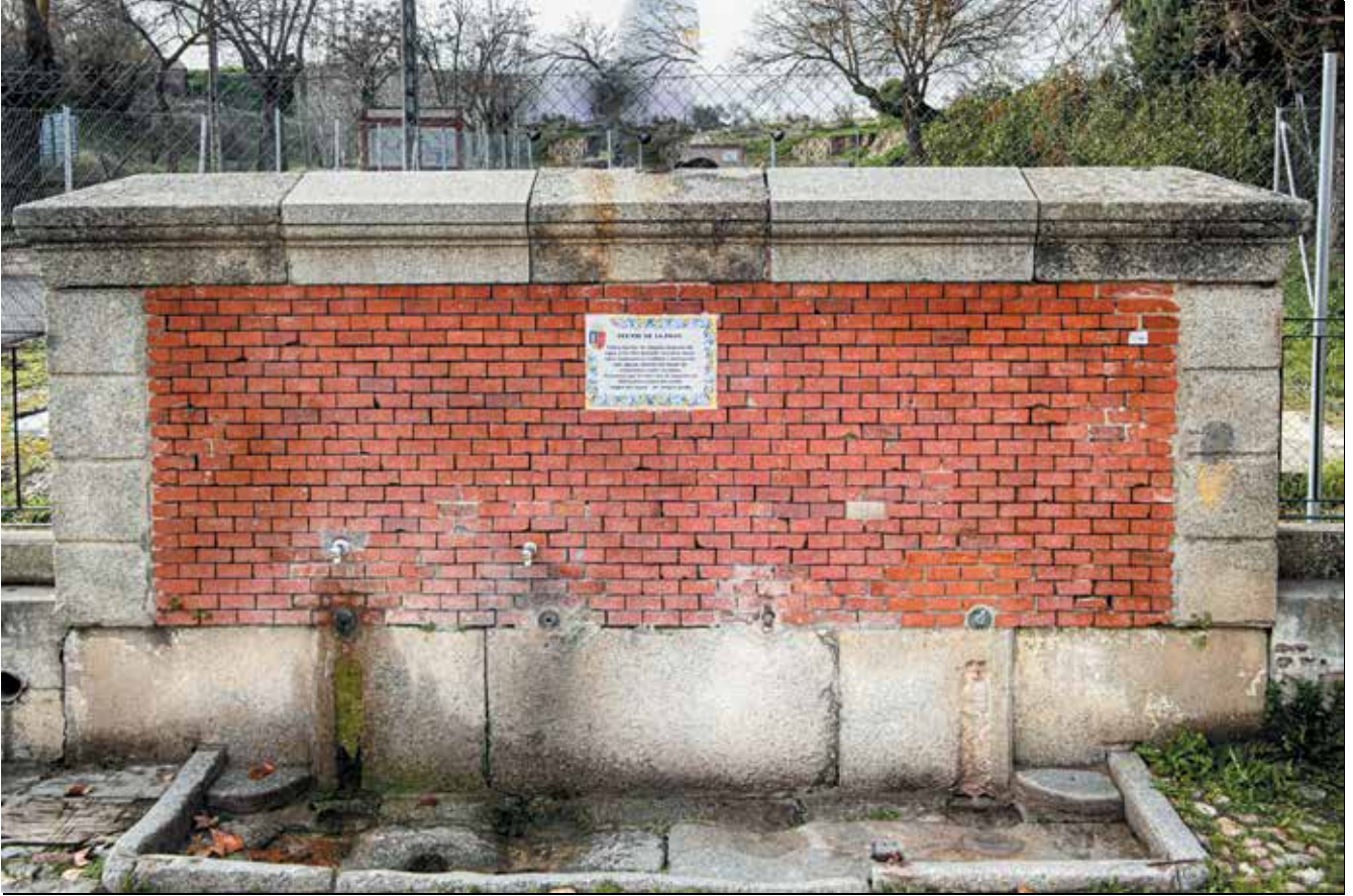
Imagen: Fuente de La Poza.