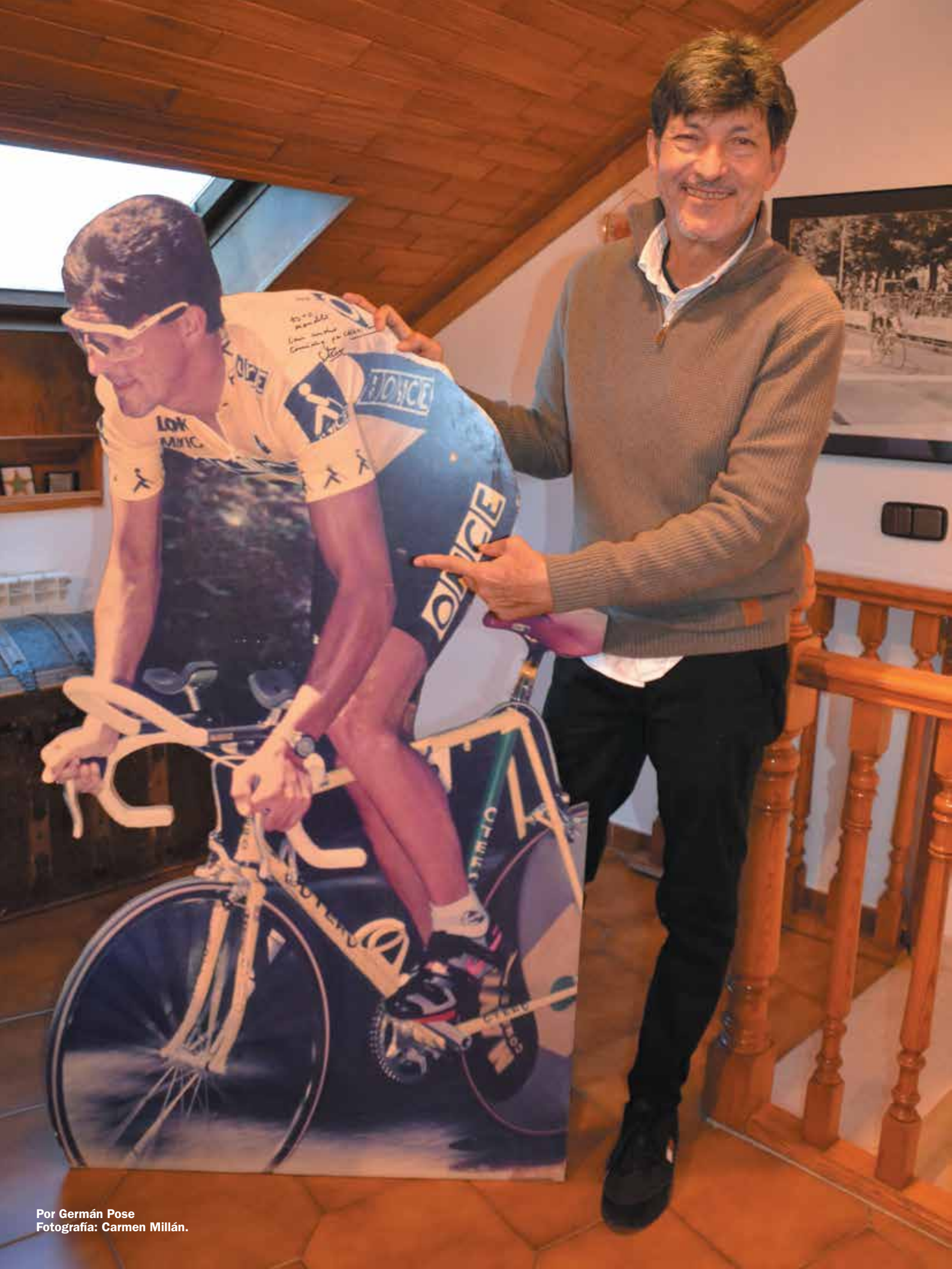
Por Germán Pose