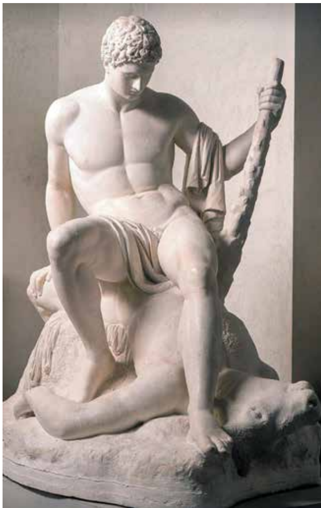
Teseo y el Minotauro. Escultura de Antonio Canova (1783).