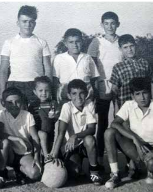
campo de La Vaquería de Pozuelo

— Había dos pueblos en uno: Pozuelo Pueblo y Pozuelo Estación.